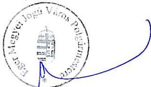
Habis László Eger Megyei Jogú Város Polgármestere