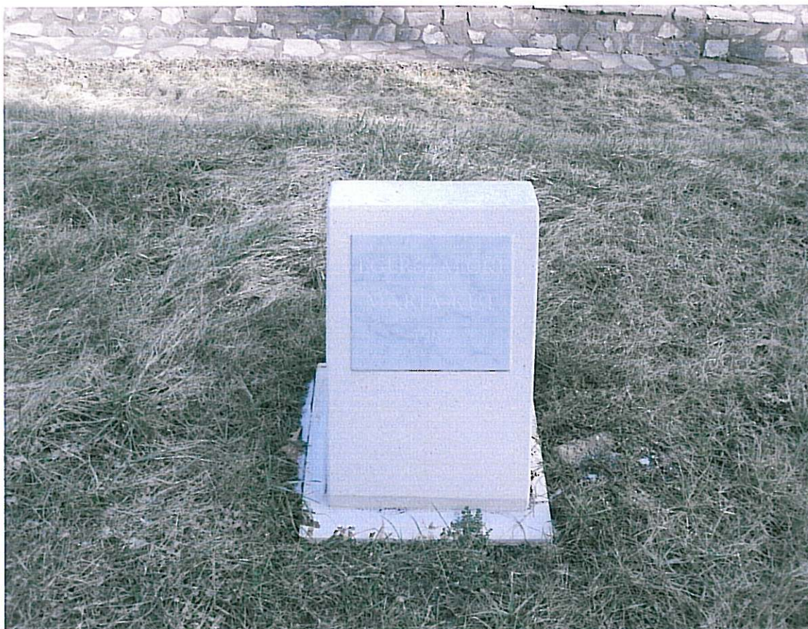
Egerszalóki Vendel Kút