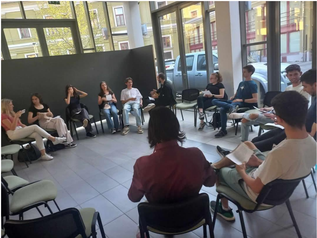
Kommunikáció és konfliktuskezelés tréning