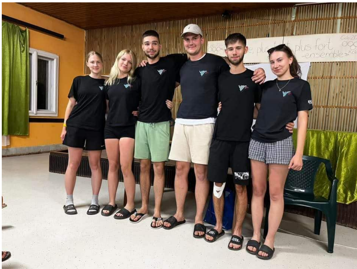
A VDT 2024/25-ös elnöksége