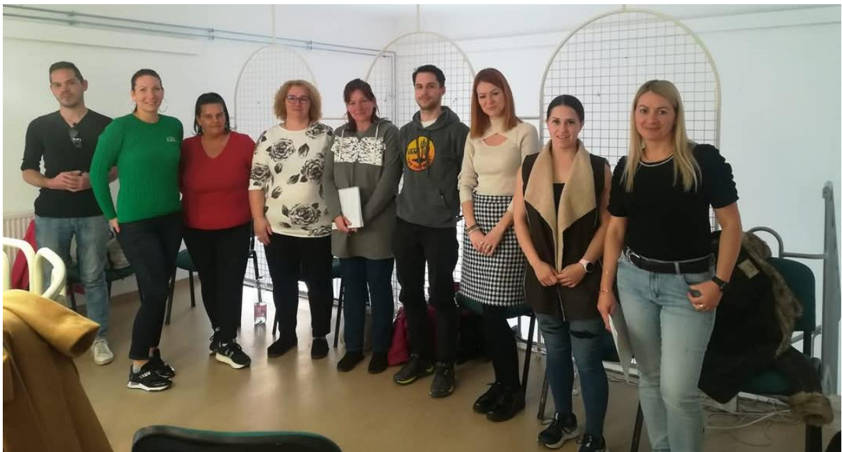
Az EKKE közösség szervezés szakos hallgatóinak látogatása