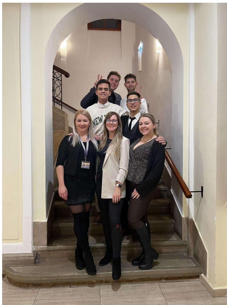
A magyar kultúra napja