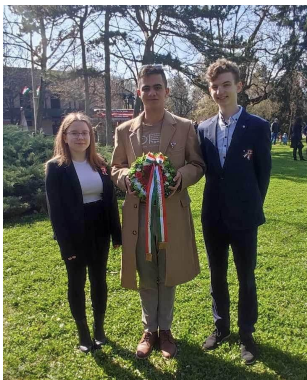
Március 15-i koszorúzás