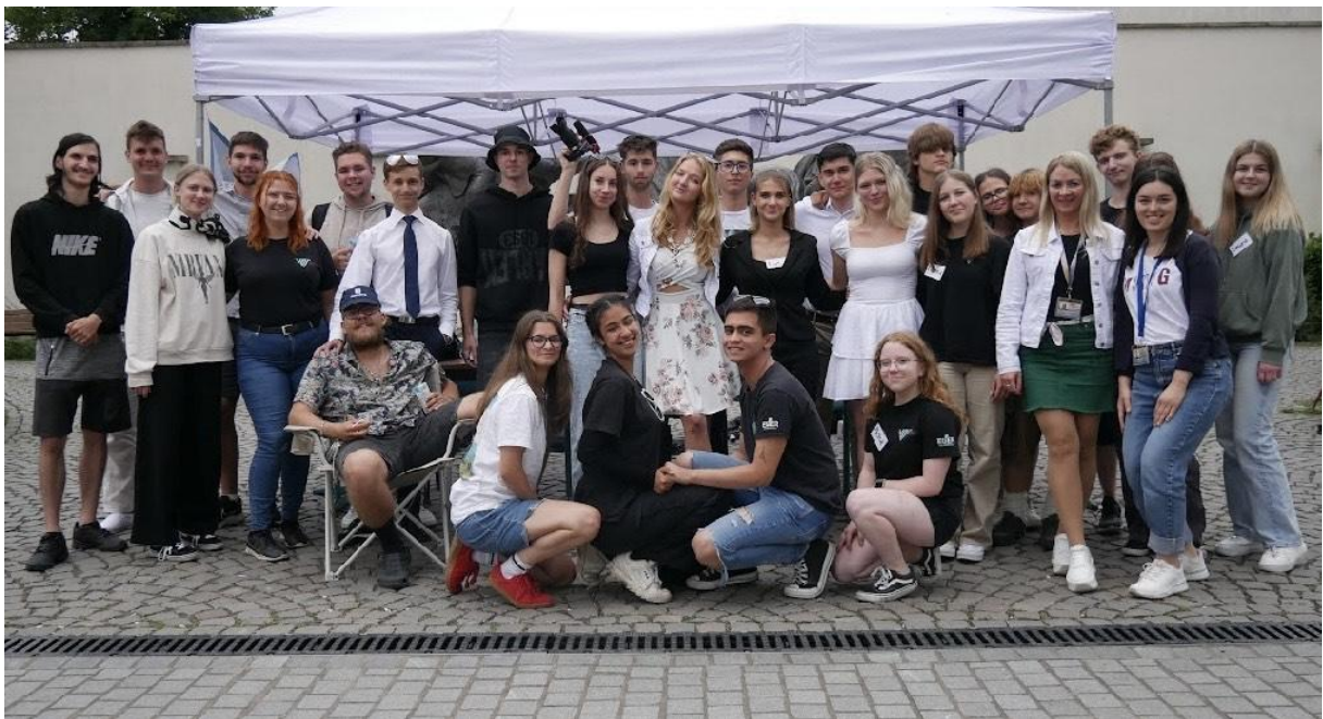
Játék Tanárok Nélkül