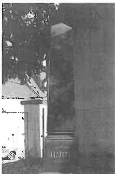
Családi sír a Gróber temetőben