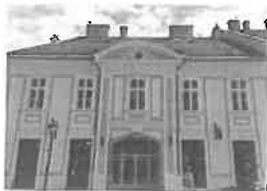
Hartl ház az Uránia mozi épülete.