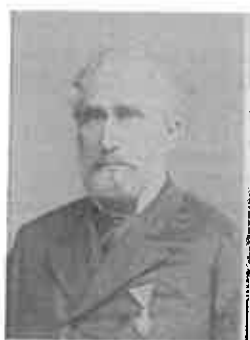
Hartl Ede családi album