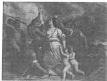
Magyarország leigázása 1849-ben (Allegorikus vázlat), 1861-62 k. olaj, fatábla 32,5x43,5 cm