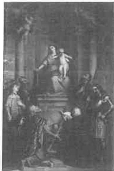
Subtuupraesidium - Magyar szentek Mária trónja előtt, 1854–58 k. olaj, vászon 73×50 cm