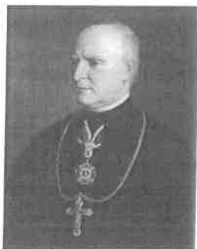
Tárkányi Béla egri kanonok arcképe, 19. sz. második fele - olaj, vászon 74×60 cm