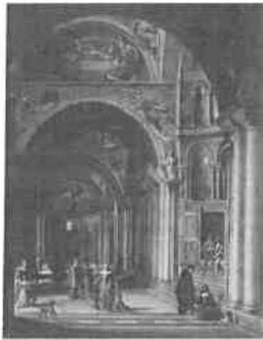
A velencei Szt. Mark templom előcsarnoka, 1875 – olaj, vászon 78×63 cm