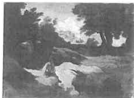
Olasz táj fiúval és szamárral, 1834 – olaj, vászon 21x27 cm