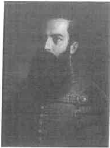
Előkelő magyar férfi piros díszruhában, 1850 k. olaj, vászon 74x56 cm