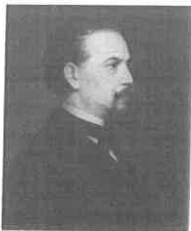
Időskori önarckép, 1870 – olaj, vászon 58×50 cm