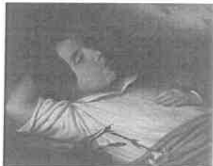
Halott gyermek, 1850 – olaj, vászon 39,8x50 cm