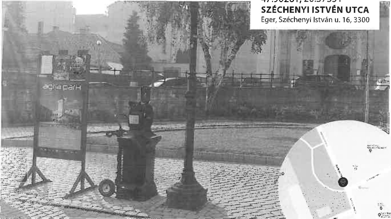
47.90261, 20.37351 SZÉCHENYI ISTVÉN UTCA Eger, Széchenyi István u. 16, 3300