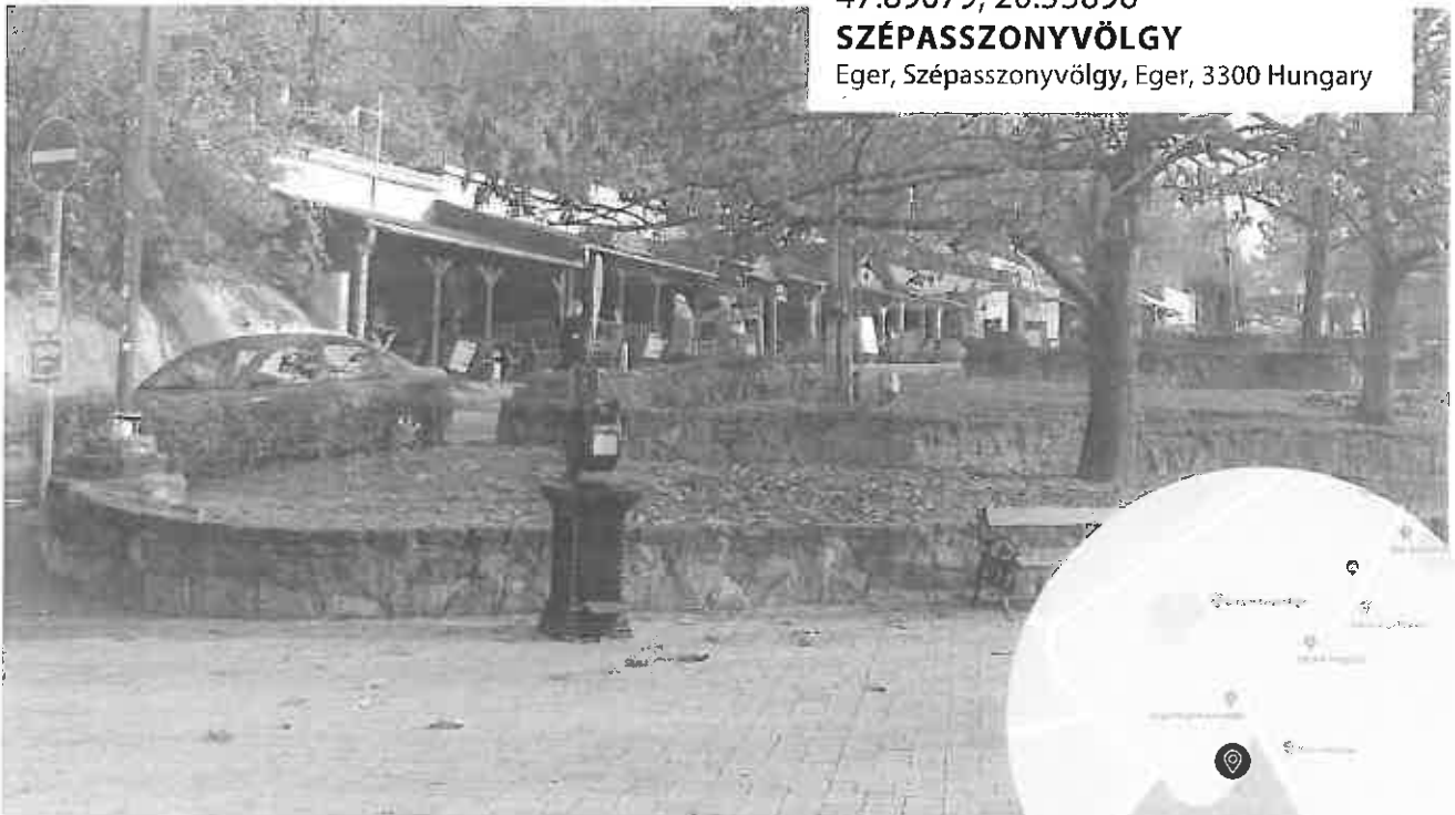
47.89079, 20.35896 SZÉPASSZONYVÖLGY Eger, Szépasszonyvölgy, Eger, 3300 Hungary