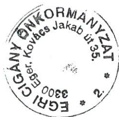
Felelős: Lakatos Oszkár

Munkaadókat terhelő járulékok és szociális hozzájárulási adó előirányzata növekszik 17.173 Ft-tal.