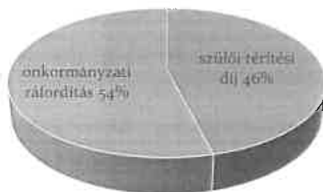
EKVI ÉTKEZÉSI KIADÁSOK

A havi összes EKVI iskolai étkező létszám (2018. összesítő adatai alapján) 2962 fő, ebből 1316 fő a valamilyen jogcímen kedvezményes (ingyenes vagy 50 %-os) étkezésre jogosult tanuló.