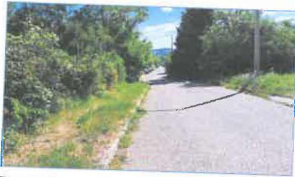
Pozsonyi u. utcaképek