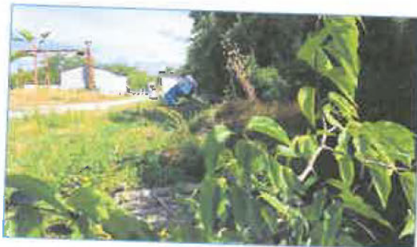
Jobb oldali telekhatár