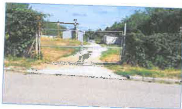
Telephely utcafronti bejárata