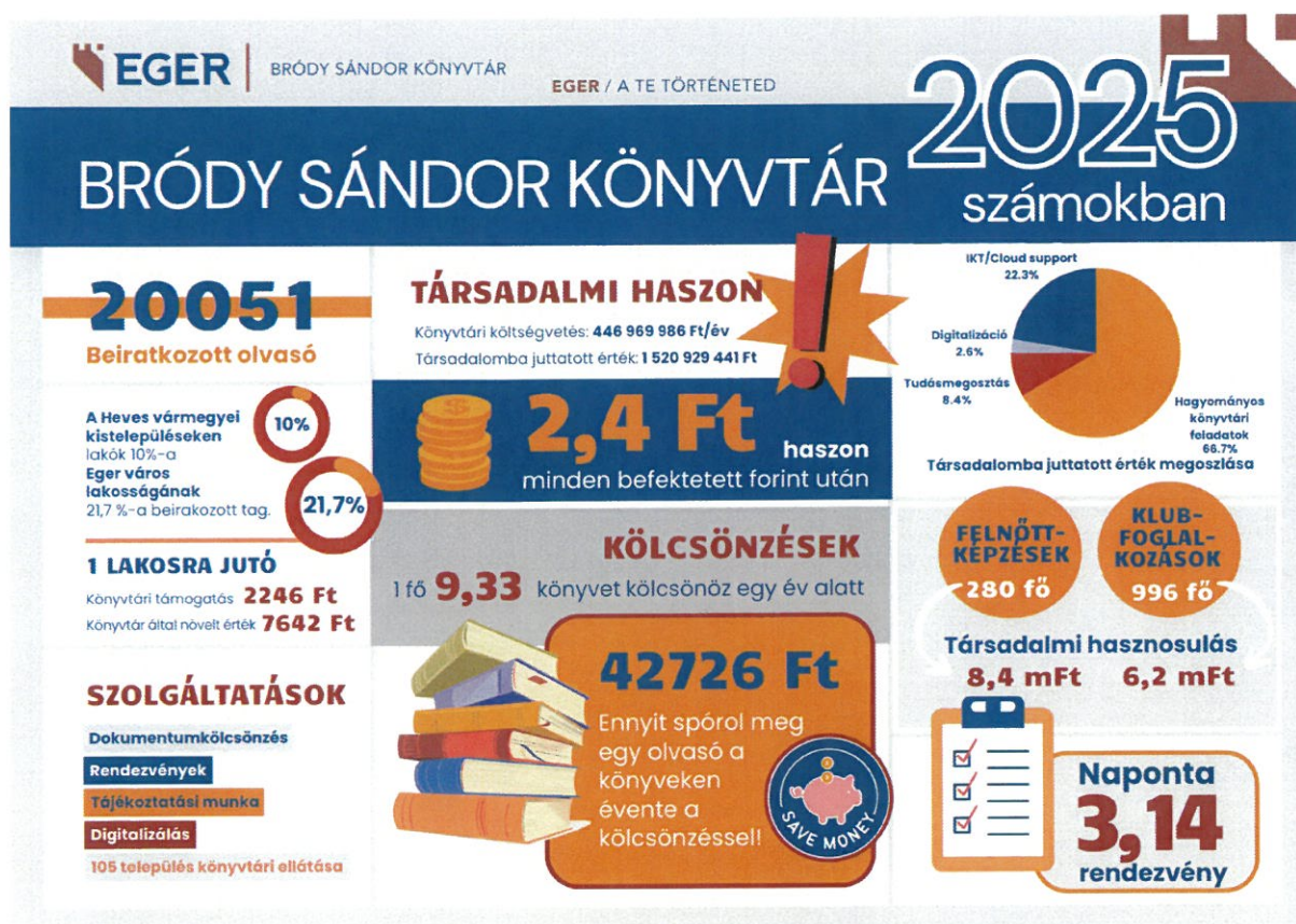
3. ábra A Bródy Sándor Könyvtár 2025. évi beszámolója. ROI mutatók

A ROI-mutató igazolja, hogy a könyvtár fenntartása nem költség, hanem megtérülő befektetés: minden ráfordított forint többszörös értéként áramlik vissza a lakossághoz. Vezetőként céloom, hogy ez a számítási módszer a kulturális intézményekben országsszerte meghonosodjon, s a kultúra közgazdaságtana egyik számítási módszerévé válhasson – bemutatva a szféra számszerűsíthető, forintosítható eredményeit.