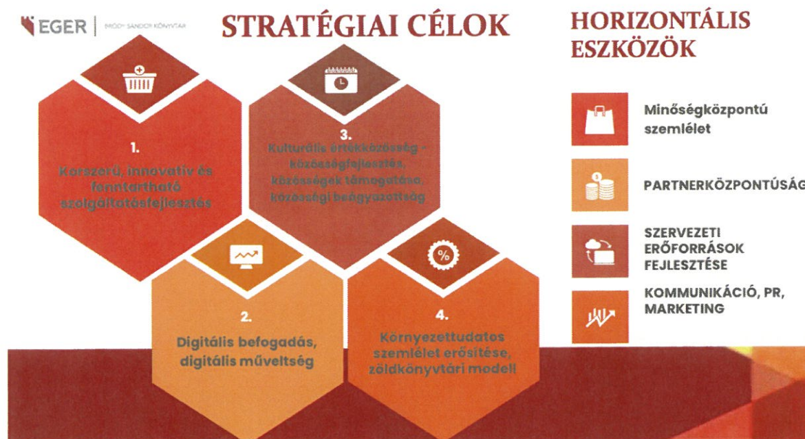
1. ábra Bródy Sándor Könyvtár Stratégiai terv 2024-2028. Saját ábra