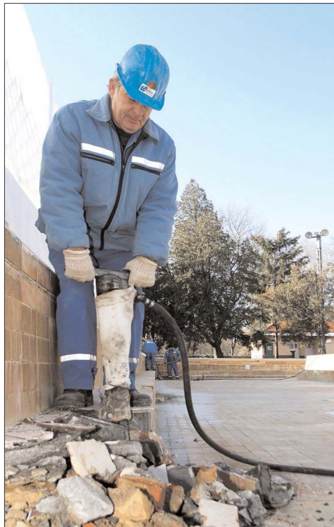
Folynak a munkák a közkedvelt medencében

3. Eger MJV Önkormányzatának 2005. évi irodaszer beszerzése tárgyában kiírásra kerülő egyszerű közbeszerzési eljárás keretében 2005. május 1-től június 30-ig terjedő időszakokra vonatkozó beszerzésekre keresünk beszállítókat.