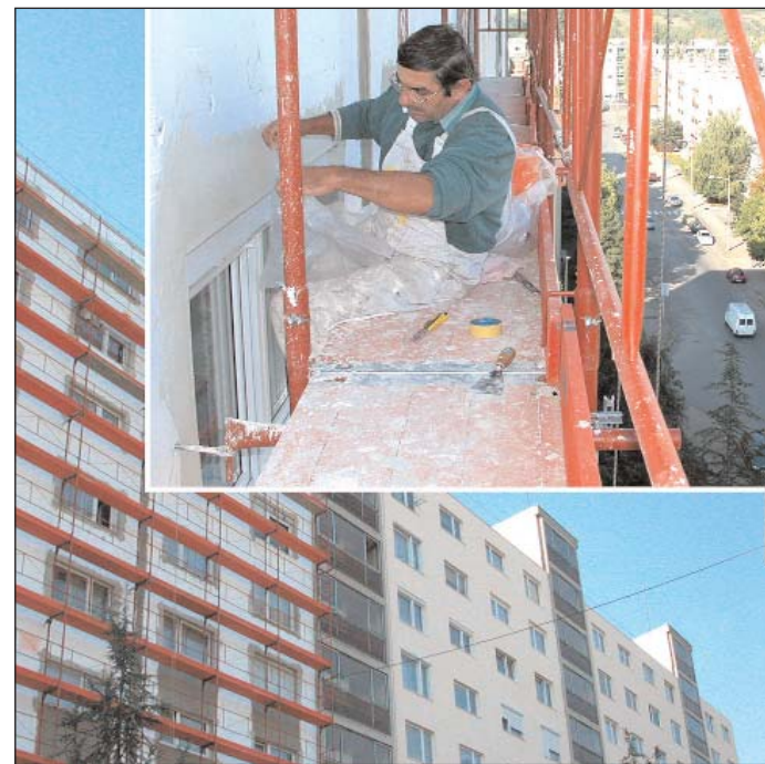
PANELPROGRAM. Eger 2002-ben kapcsolódott be az iparosított technológiával épített – panel, blokk, alagútszaló, öntöttfalas, vasbetonváz – lakóházak felújítási programjába 42 lakás homlokzati hőszigetelésével. 2003-ban 283 lakás nyert, tavaly pedig 10 társasház – 514 lakás – nyújtott be pályázatot. Az országos elbírálás tavasszal várható. A konstrukcióban a költségeket egyharmad-egyharmad arányban fedezi az állam, az önkormányzat, valamint az ingatlan tulajdonosai. A programra az idei évben is sor kerül, s az indításról szóló kormánydöntést követően a kiírást a Városi Újságban is közzé tesszük. A kétharmados támogatottságú konstrukcióban a pályázatot első körben az önkormányzathoz kell benyújtani. A közös képviselőket a hivatal a lehetőségekről levélben is tájékoztatja, ezért is kérjük, hogy azok a közös képviselők akik eddig nem voltak kapcsolatban az önkormányzattal, vagy megváltozott a címük, jelezzék elérhetőségüket a lakossági referensnél. Az önkormányzat eddig minden pályázatot támogatt.