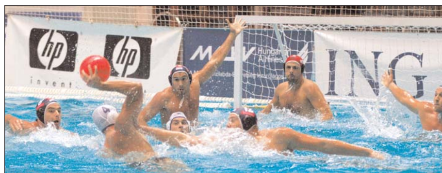
A Brendon-Fenstherm-ZF-Eger vízilabdacsapata előbb a Magyar Kupa döntőjébe verekedte magát, majd a LEN-kupa bresciai mérkőzésein a leg-több gólt dobva jutott tovább. A csapat a második körben hazai pályán bizonyíthat: a Bitskey Aladár Sportuszoda ad otthont a hét végén az egriek csoportmérkőzéseinek a legjobb 16 közé jutásért

Városi Újság * Eger polgármesteri hivatalának kiadványa * Cím: Polgármesteri hivatal Eger, Dobó tér 2. * Telefon 36/523-700 Terjesztve ingyenesen, 24 000 példányban, Eger városában A kiadvánnyal kapcsolatos észrevételekkel hívja Szüle Rita sajtóreferenst: 523-700/711 - ISSN 1586-2313