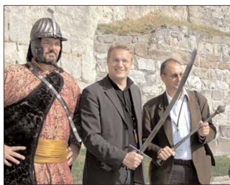
A zsűri néhány tagja kardot is ragadott

Lapzártakor érkezett a hír, hogy a kormány döntött: Pécs városát javasolja Europa 2010-es kulturális fővárosának .