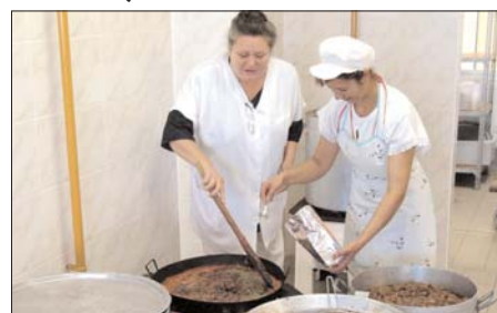
Új konyhát és éttermet kapott az egri Szilágyi Erzsébet Gimnázium és Kollégium. Az október 6-án felavatott menzán a diákok korszerű, szép körülmények között étkezhettek