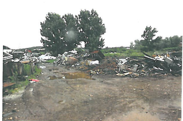
A frissen lerakott hulladék, törmelék, fémhulladék