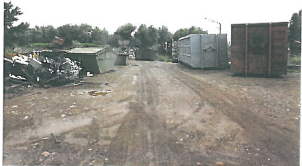
A vizsgált telek nyugati vége