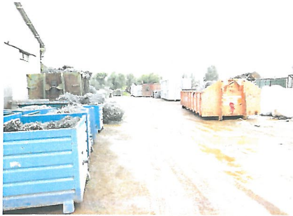
A hátsó telekrész felé vezető út a 9883/18 hrsz-ú telekből