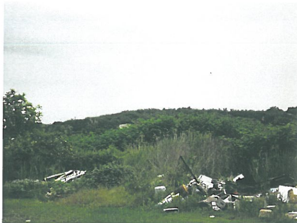
A törmelékhalomok mögött burjánzó növényzet fedí

Az eltelt időszakban sem a forgalmi viszonyok, sem a telek adottságai nem változtak oly mértékben, hogy az a vizsgált telekrész forgalmi értékét befolyásolta volna az elmúlt két évben. Az értékmódosító tényezők, körülmények kiegyenlítődnek.