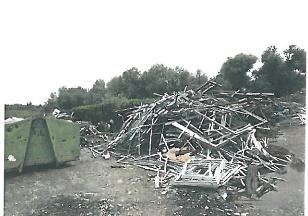
A telek sáros, gödrös és fémhulladék tárolására használják egy részét