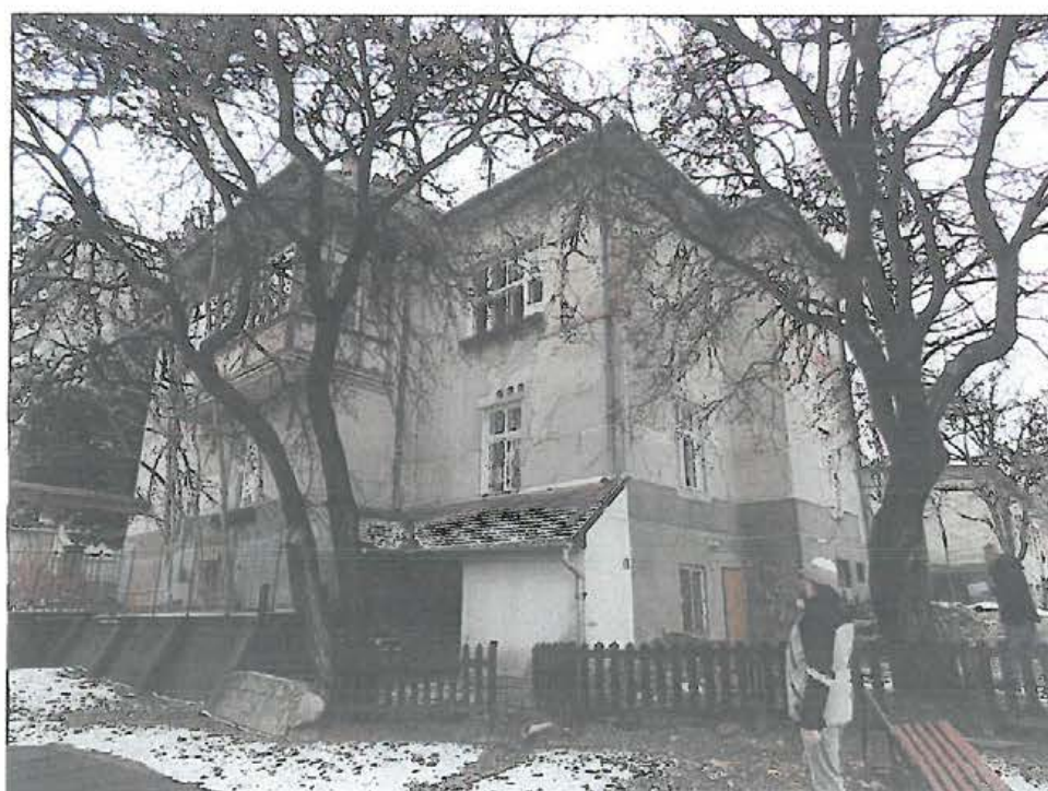
Az épület kelet felől