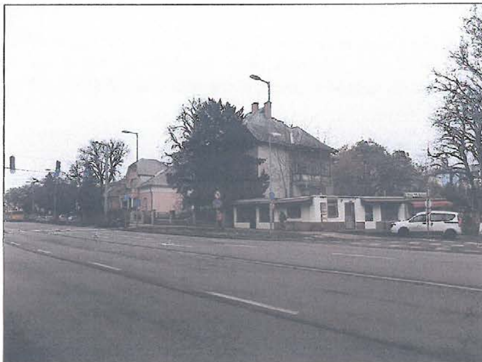
Az ingatlan délnyugat felől