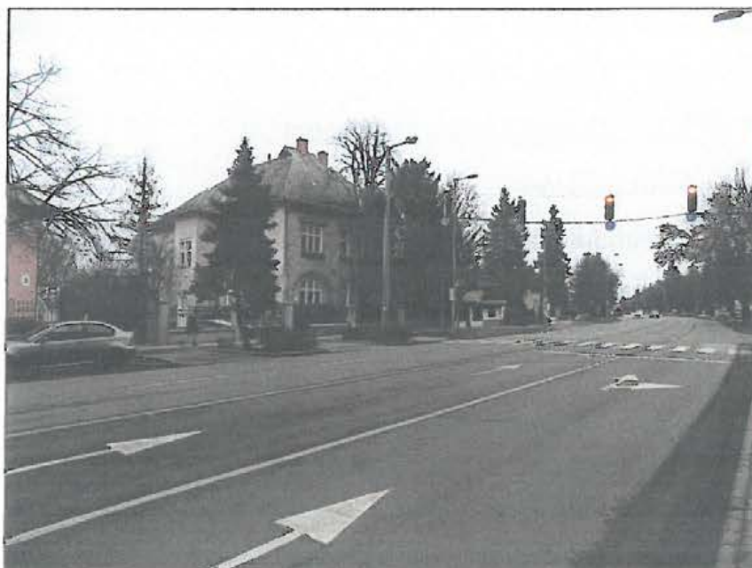
A Deák Ferenc utca

Eger, 6622 hrsz-ú ingatlan telkének fajlagos értékéről, valamint a rajta lévő önkormányzati tulajdonú épület értékéről