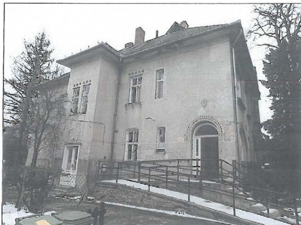
Az épület észak felől