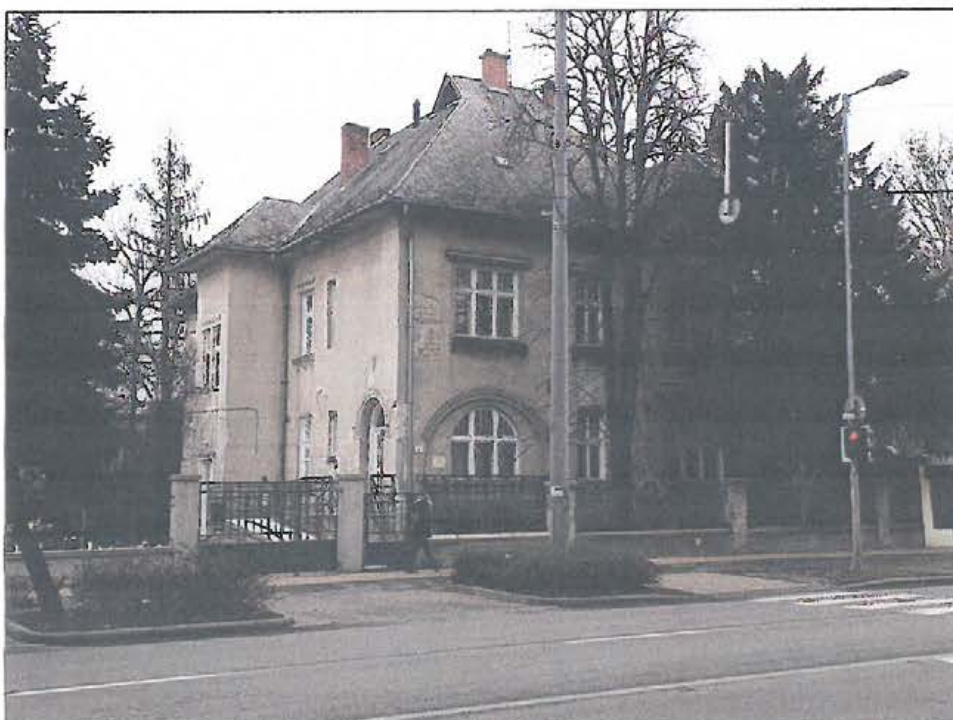
Az épület homlokzata