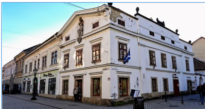
A társasház utcai homlokzata