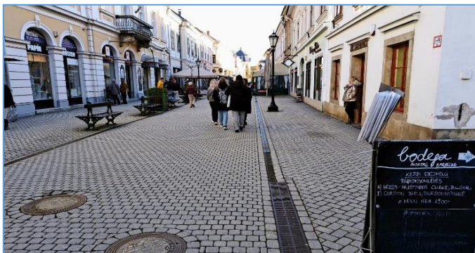
Széchenyi I. utca,