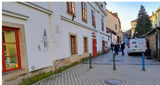
Bródy S. utca, utcaképek