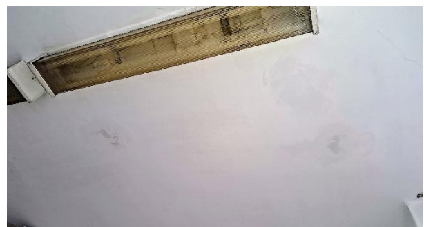
Beázásra utaló jelek