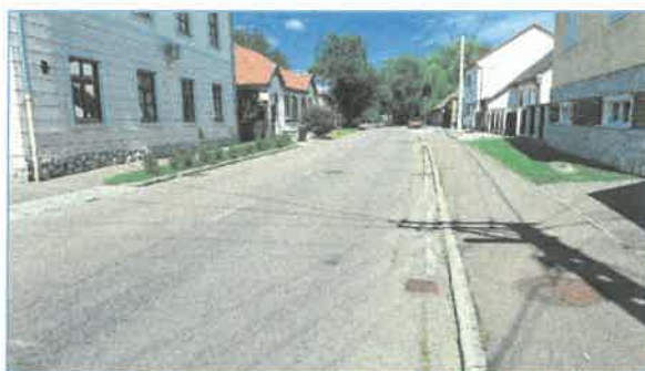
Kovács J. u. utcakép részletek