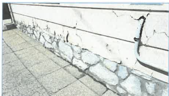
Falvizesedés a homlokzati részekben