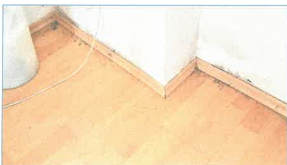
Belső oldal falvizesedése