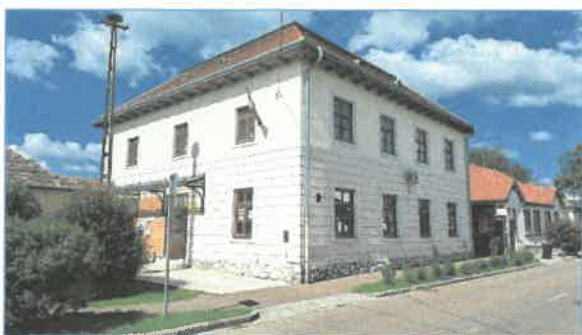
Épület utcai nézete