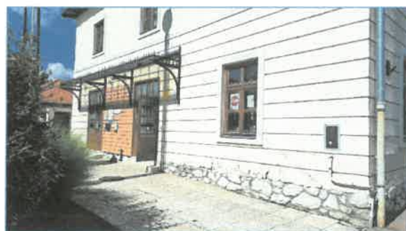
D-i, udvari homlokzat