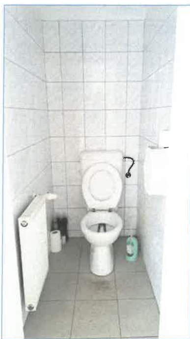
Előtér, mosdó, WC részletek