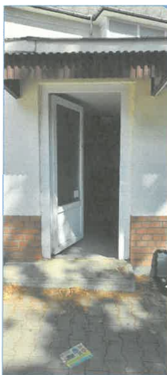
Értékelt üzlet bejárata