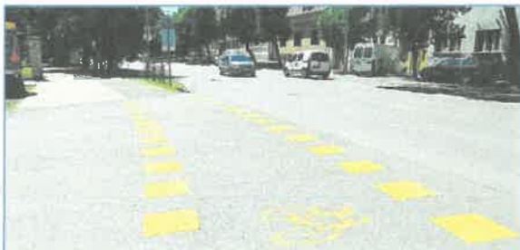
Deák F. u. utcaképek