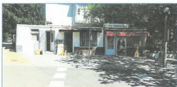
Üzletek a Stadion utca felől