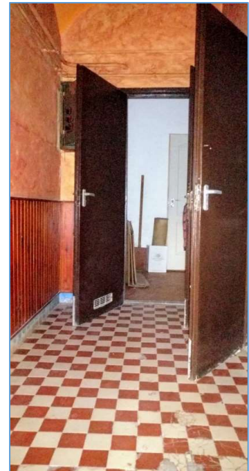
Közlekedő a mosdó-WC felé