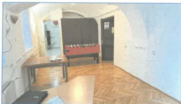
Udvari iroda részlet