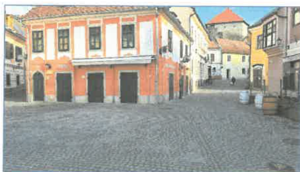
„Kis” Dobó tér, nézet a Dobó u. felé