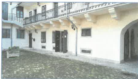
Belső udvar nézete