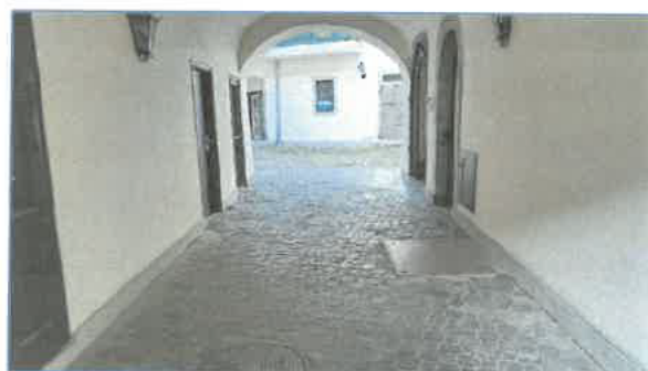
Dobó tér 9. kapualj bejárat az udvarfelé