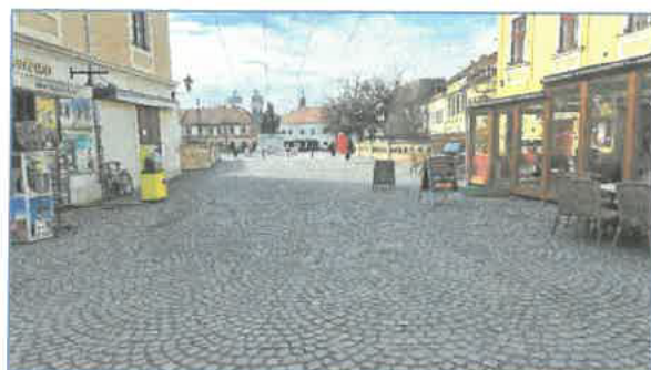
Dobó tér utcakép