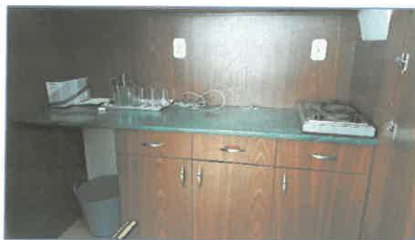
Beépített teakonyha részlete