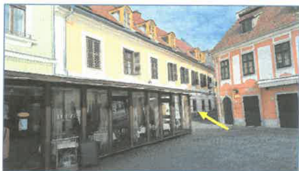
Dobó tér 9. utcai homlokzat