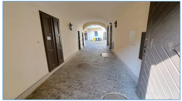
Kapualj bejárat az üzlet felé