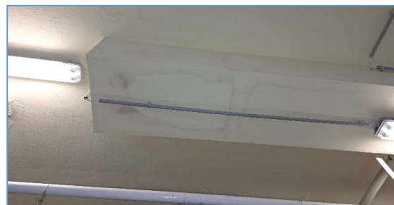
Szennyvíz ejtővezetékéről történő korábbi beázás részletek