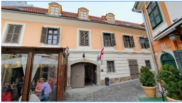
Dobó tér 9. utcfronti nézet