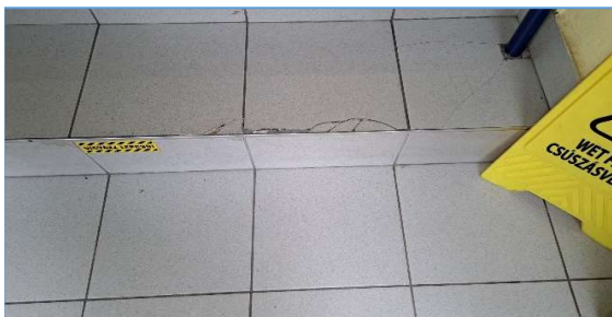
Belső lépcsőburkolat állapota