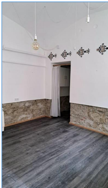
Levert vakolat (kiszáritáshoz?)