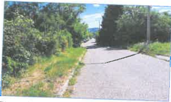
Pozsonyi u. utcaképek