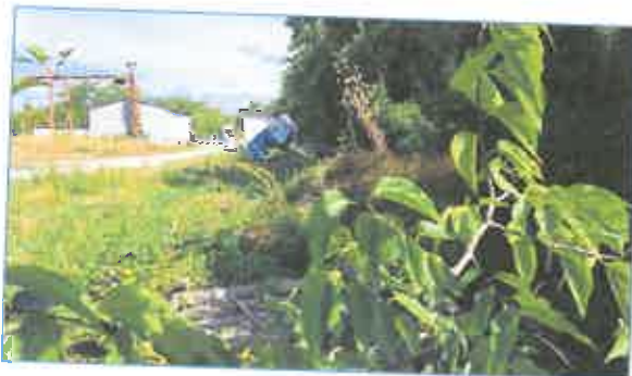
Jobb oldali telekhatár