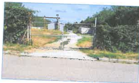
Telephely utcafronti bejárata