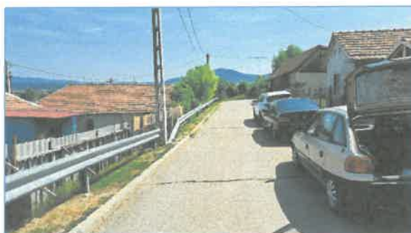
Béke út utcaképek