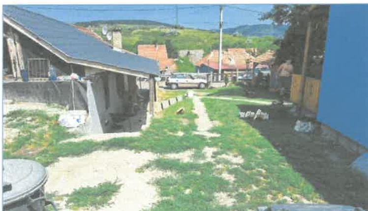
„Kert” felőli nézet”