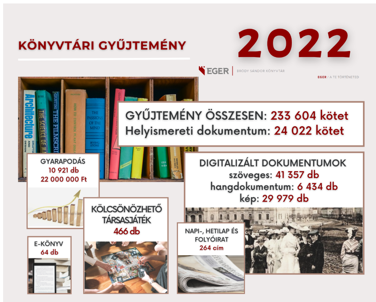
4. ábra: Könyvtári gyűjtemény

A 2022-ben beszerzett 21610 db dokumentum állományba vétele és szabványos feldolgozása a katalógusban történő visszakereshetővé tétele megtörtént. A könyvek rekordjainak 19%-a más adatbázisokból honosítható volt, de a tartalmi és formai feltárás megfelelőségét minden esetben ellenőriztük, javítottuk a tárgyszavakat, raktári jelzeteket. A rekordok 69%-a volt többszörözhető, 12%-a pedig saját feldolgozást igényelt. 362 analitikus rekordhoz 5263 analitikát készítettünk. A helyismereti sajtófigyelés eredményeként 590 cikkeírás került a katalógusba.