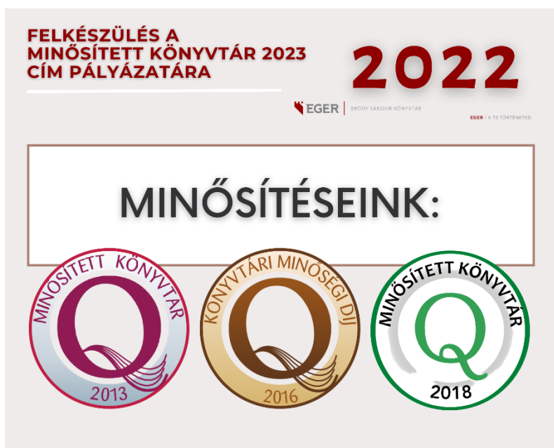
7. ábra: Felkészülés a Minősített Könyvtár 2023 cím pályázatára

2022-ben tudatos tervezéssel, belső képzésekkel készültünk az újabb minősítésre. A MIT irányításával 8 munkacsoportban dolgoztunk, 2022-ben a dolgozói teljesítmények értékelésre a TÉR, valamint a környezettudatos szemlélet fejlesztésére a Zöldkönyvtár munkacsoport alakult meg. Szervezeti önértékelést végeztünk a KMÉR alapján, frissítésre kerültek az intézményi folyamatszabályozás dokumentumai. Felhasználóink körében igényfelmérést végeztünk új szolgáltatásaink bevezetése előtt, valamint ezt követően teljes körű használói elégedettségmérés zajlott. Mértük dolgozóink elégedettségét, a szervezeti kultúra és a belső kommunikáció szintjét, belső képzéseink résztvevőinek A dokumentumállomány rendszeres selejtezése, válogatása elengedhetetlen elégedettségét. A TÉR keretében bevezettük a munkatársak egyéni teljesítményének kompetencia alapú mérését, amely önértékeléssel, vezetői értékeléssel és értékelő konszenzussal zárult. A KSZR keretében megyei szolgáltatásainkkal kapcsolatban két alkalommal mértük a partnerek és a használók elégedettségét. 2022-ben lezárult intézményünk stratégiai ciklusa, amelynek értékelése megtörtént, 2023-tól új intézményi stratégia mentén dolgozunk. A Heves megyei könyvtárak körében helyzet- és igényfelmérést végeztünk egységes minőségfejlesztési koncepció kidolgozására.