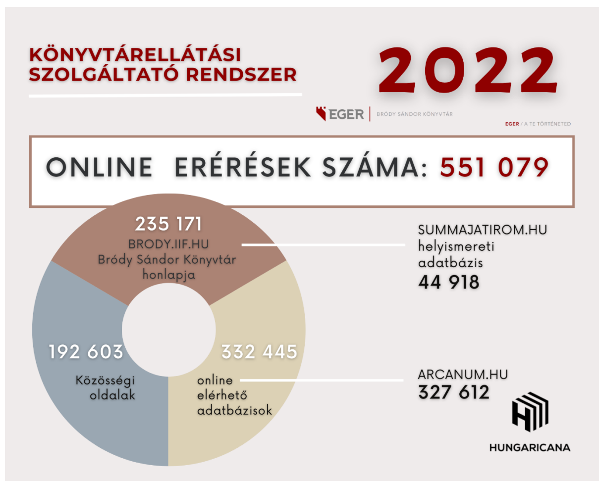
10. ábra: A könyvtár, mint virtuális tér