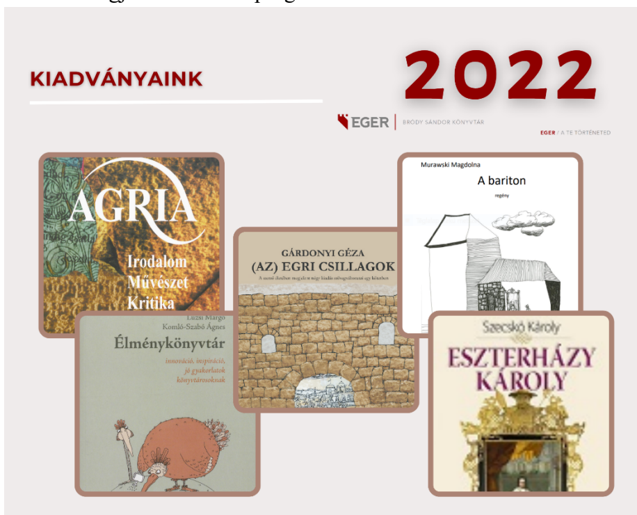
8. ábra: Kiadványaink