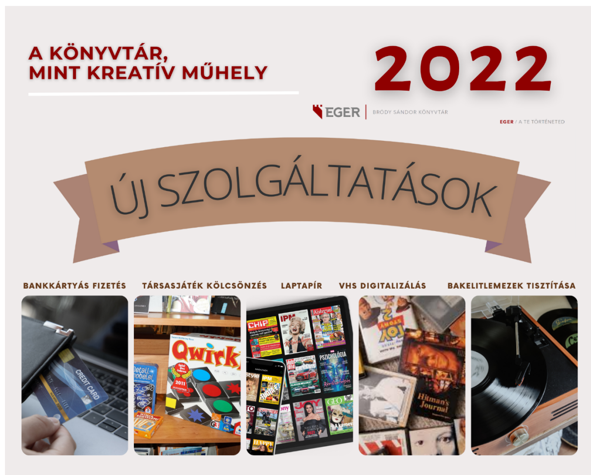
3. ábra: A könyvtár, mint kreatív műhely