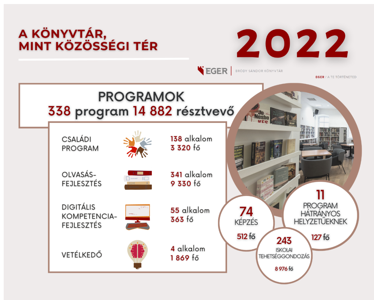
6. ábra: A könyvtár, mint közösségi tér

A Nagy Könyves Beavatás folytatásaként könyvtárunk az IKSZ és a NKA támogatásával hirdette meg A Sztori című országos kreatív olvasásnépszerűsítő játékot, melyre határon innen és túlról összesen 50 csapat regisztrált 148 fővel a Junior, Tini, Felnőtt és Családi kategóriákban.