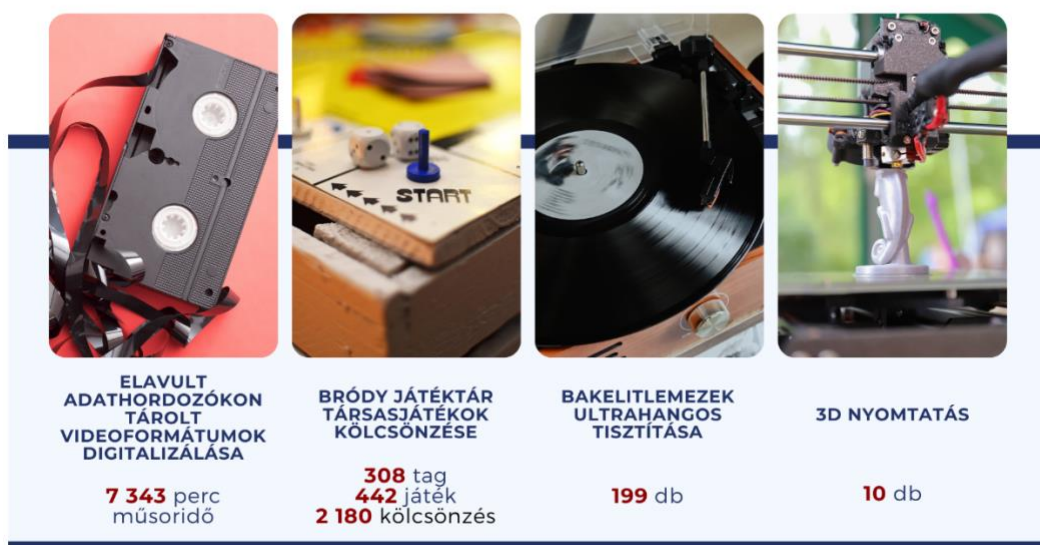
7. ábra A könyvtár, mint kreatív műhely