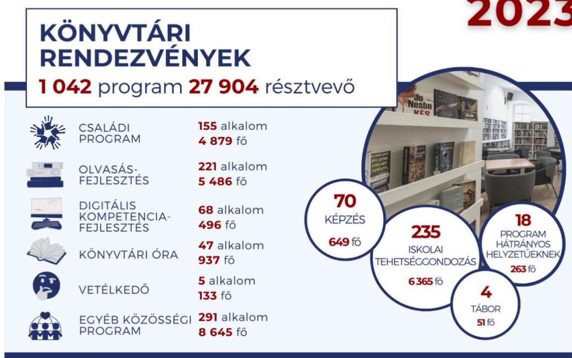
6. ábra: A könyvtár, mint közösségi tér

A nemzetiségi ellátást elsősorban az Országos Idegennyelvű Könyvtár által biztosított keretösszegeből, a Goethe Intézet ajándékaiból (a német nemzetiség számára), és saját beszerzési keretből fedezzük. 2023-ban a német, ruszin, lengyel, szlovák és roma kisebbségek számára 154 dokumentummal gyarapodott állományunk. Idegen nyelvi folyóirataink továbbra is az olvasók rendelkezésére állnak.