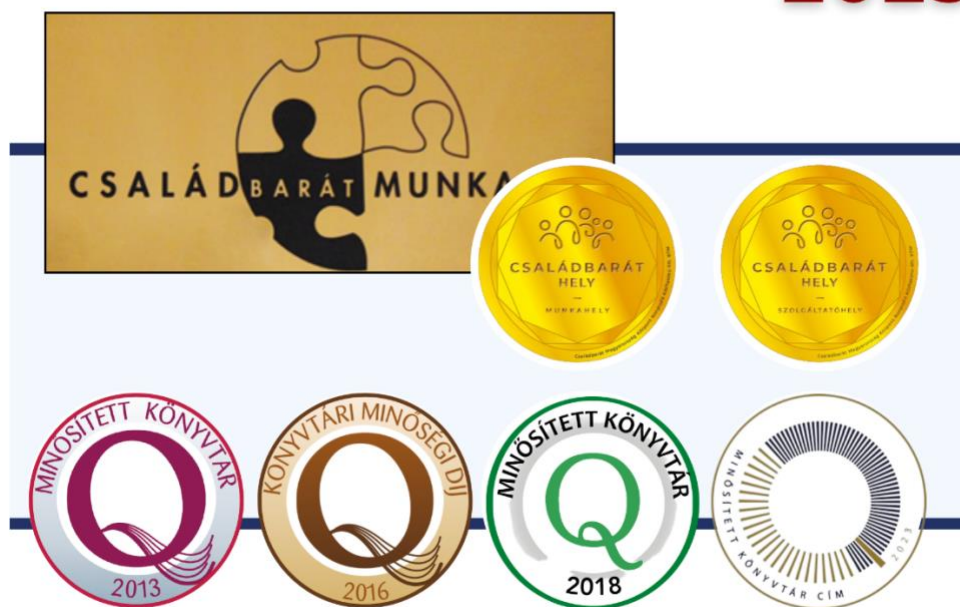
8. ábra: Minősítéseink