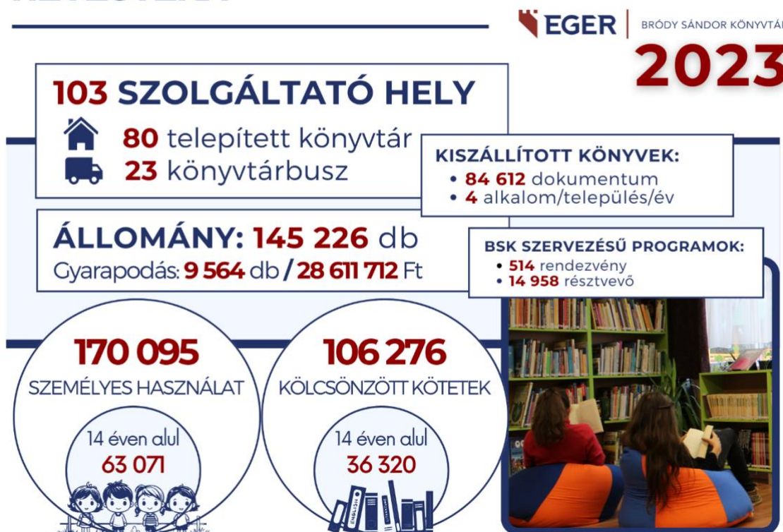
7. ábra: HEVESTÉKA – Könyvtárellátási Szolgáltató Rendszer