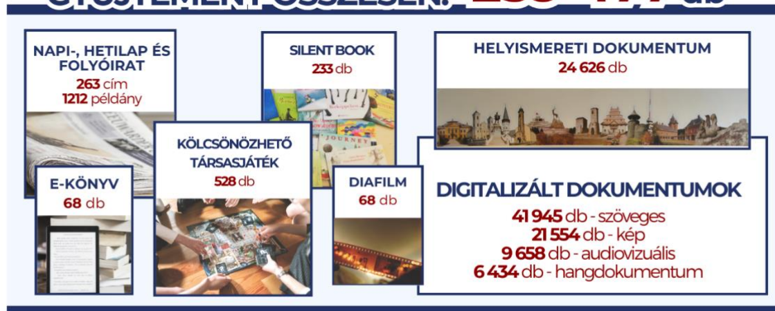
4. ábra: Könyvtári gyűjtemény