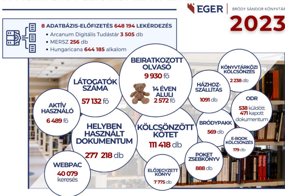
5. ábra: Könyvtár a kultúra szolgálatában

A Petőfi 200 emlékév keretében a magyar költészet napján egész napos műsorfolyammal emlékeztünk, minden korosztály elszavalhatta kedvenc versét egymásnak adva a szót és a mikrofont. A Gárdonyi Géza Színház fiatal művészei nálunk is bemutatták „A XXI. század költője” irodalmi összeállítást.