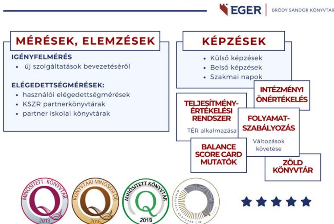
1. ábra: Minősített könyvtári szolgáltatások 2013-tól