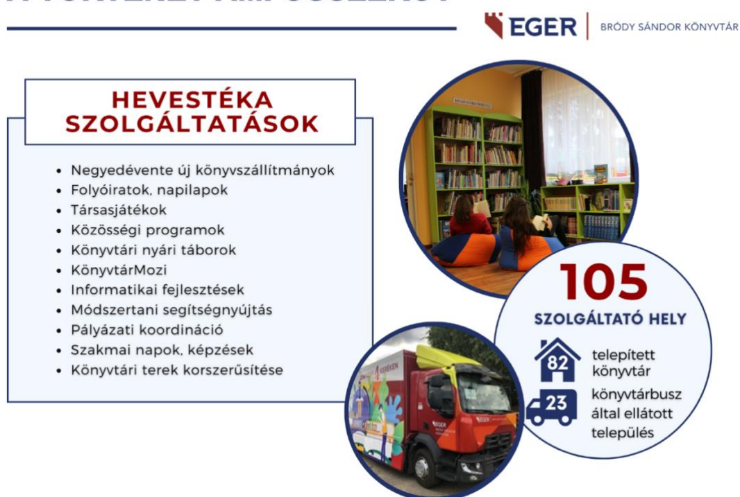
2. ábra: Hevestéka: a történet, ami összeköt