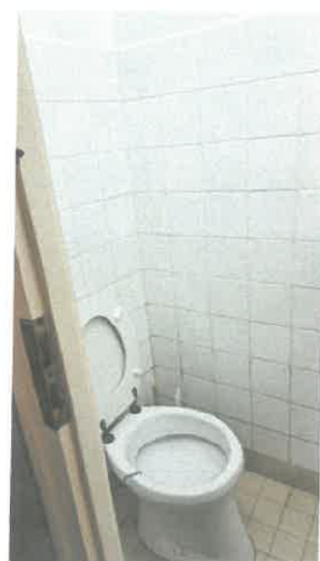
Dobó tér 9. mellékhelyiségek