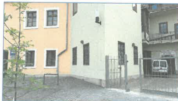
Dobó tér 7. Végvári V. tér felől