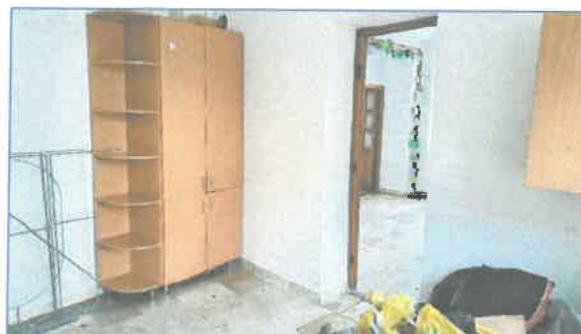
Belső részletek, Dobó 9. részen