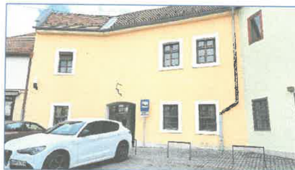
Dobó tér 9. Végvári V. tér felől