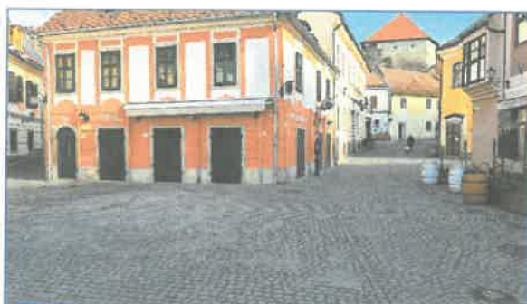
„Kis” Dobó tér, nézet a Dobó u. felé