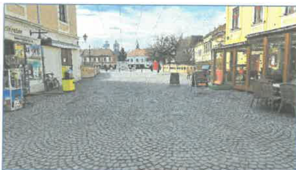
Dobó tér 7. utcakép