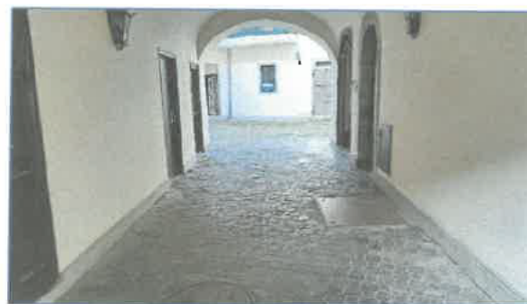
Dobó tér 9. kapualj bejárat az udvarfelé