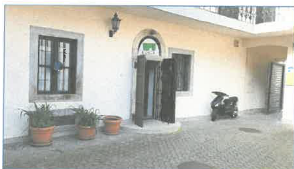
Belső udvar, iroda bejárata, Dobó tér 9.