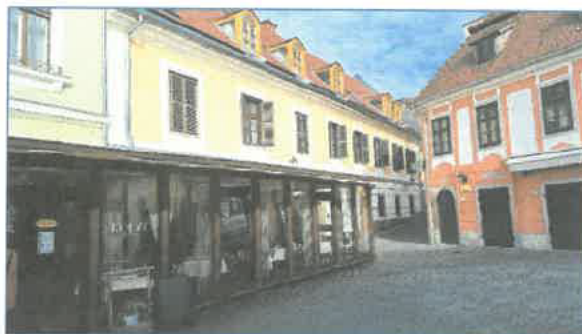
Dobó tér 9 homlokzat, utcakép