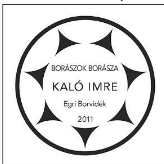
márvány tábla, betűtípus: Avenir

Mind a két lehetőség választható, más városokban elsősorban a felső táblát választották, mert ez a Borászok Borászának logója